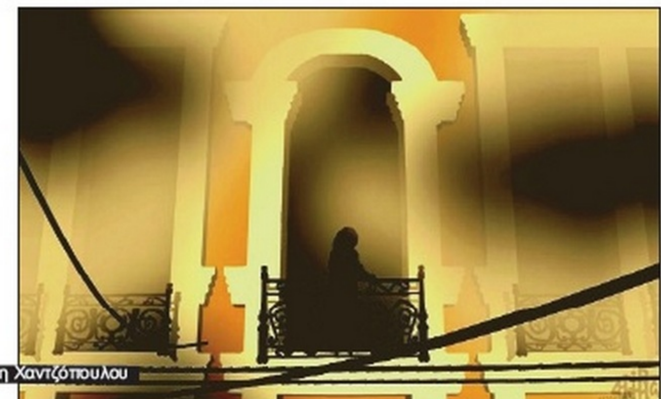
5 ΜΑΪΟΥ 2010 Η ΑΠΟΝΑΖΙΣΤΙΚΟΠΟΙΗΣΗ ΤΗΣ ΜΑΡΦΙΝ