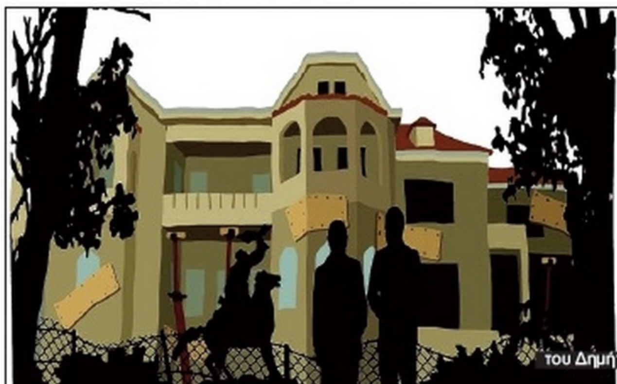
- ΛΥΠΑΜΑΙ ΠΟΥ ΤΟ ΛΕΩ ΑΛΛΑ ΤΑ ΘΕΡΗΝΑ ΣΑΣ ΑΝΑΚΤΟΡΑ ΕΧΟΥΝ ΤΑ ΧΑΛΙΑ ΤΟΥΣ. - ΚΑΙ ΠΟΥ ΝΑ ΔΕΙΤΕ ΤΟΥΣ ΜΠΟΛΣΕΒΙΚΟΥΣ ΜΑΣ.